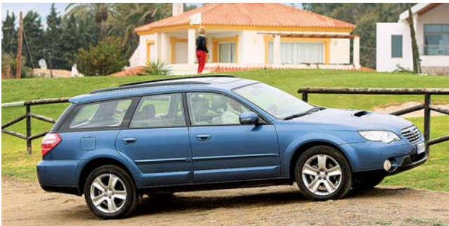
Mit 150 PS und 350 Nm aus 2,0 Liter Hubraum schafft der Subaru 200 km/h