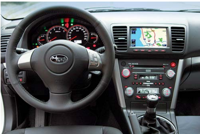
Hochwertige Materialien, gute Serienausstattung, übersichtliche Bedienung