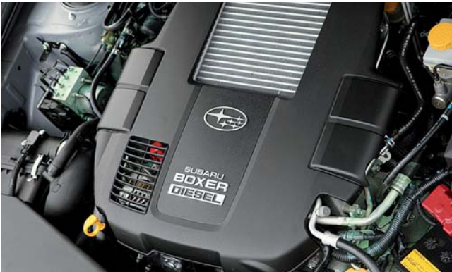
Der erste Boxer-Diesel der Neuzeit. In einem Serien-Pkw gab's das noch nie