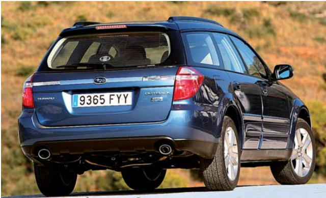
Als Diesel ist der Outback eine Alternative zu Audi Allroad und Volvo XC70